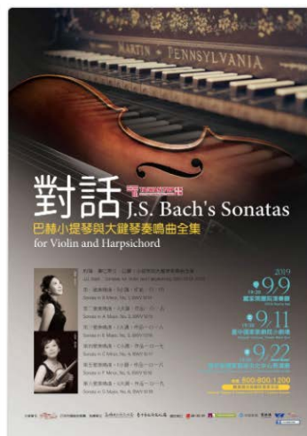
《對話 - 巴赫小提琴與大鍵琴奏鳴曲全集》 2019-09-09