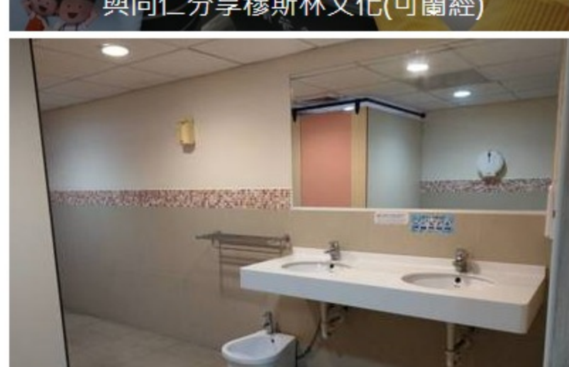
設於廁所內的洗腳盆