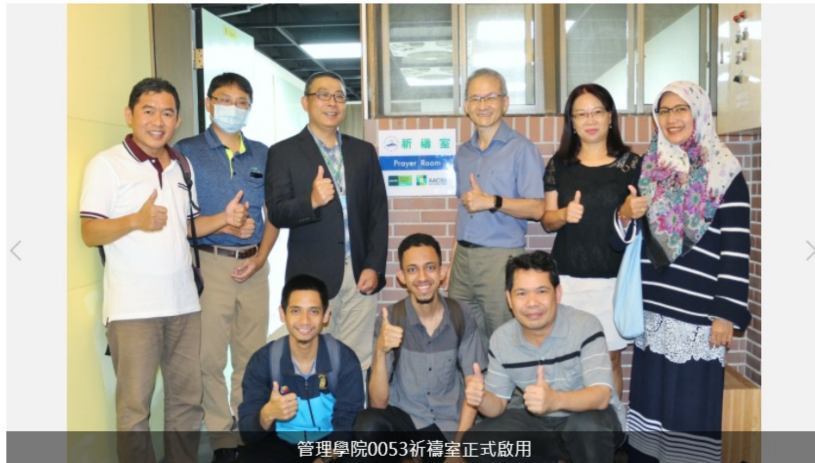
管理學院0053祈禱室正式啟用