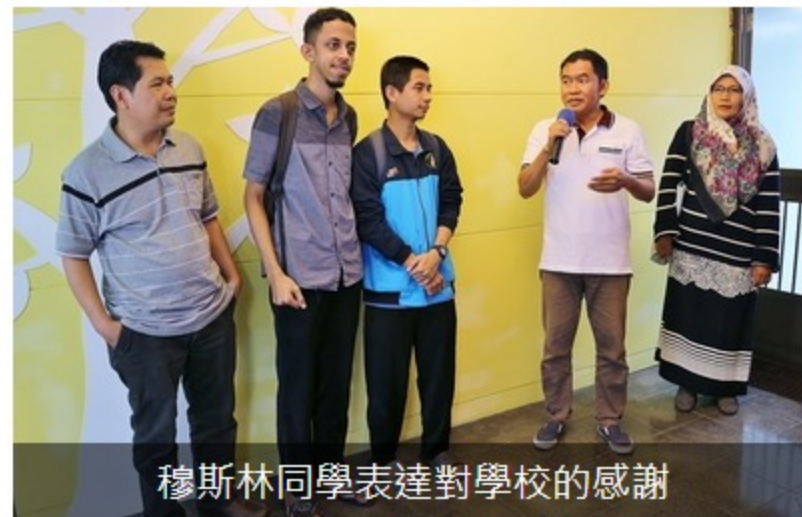
穆斯林同學表達對學校的感謝