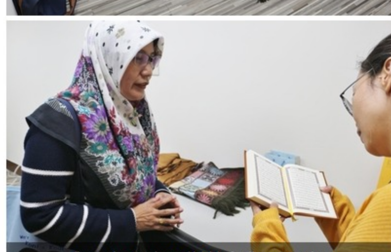
與同仁分享穆斯林文化(可蘭經)