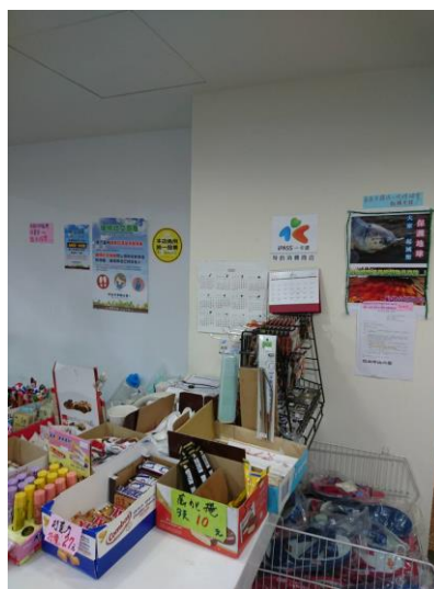
各場管張貼減塑公文